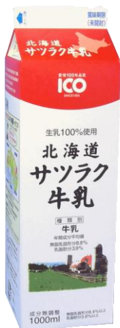
①製品名 北海道サツラク牛乳