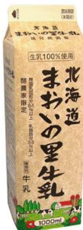
④製品名 北海道 まおいの里牛乳