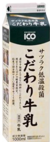
③製品名 サツラク低温殺菌 こだわり牛乳