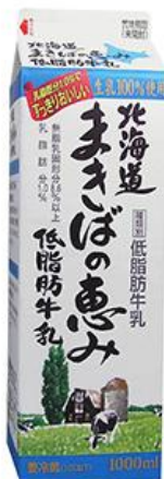
⑥製品名 北海道 まきばの恵み 低脂肪牛乳